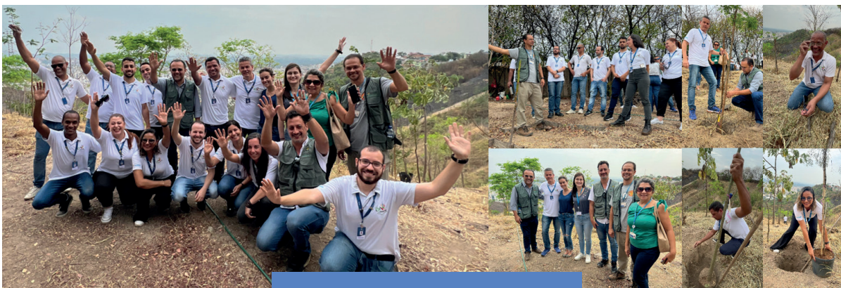
Belo Horizonte – Minas Gerais – Brasil Parque Fernando Sabino