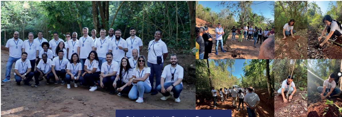
Sabará – Minas Gerais – Brasil Parque Natural Chácara do Lessa

Desta forma, essa ação contribuiu para o alcance dos Objetivos do Desenvolvimento Sustentável (ODS) nas metas 13 – “Ações contra a Mudança Global do Clima” e 15 – “Vida Terrestre”, do Pacto Global e das Diretrizes estratégicas do SESCOOP/MG, através da captação de carbono e preservação de espécies da fauna e flora local.